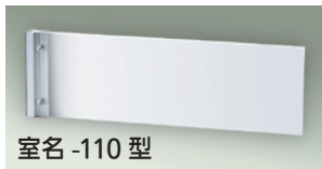
室名 -110 型