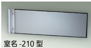
室名 -210 型