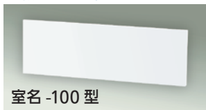
室名 -100 型