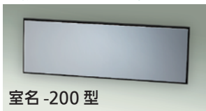
室名 -200 型