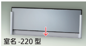
室名 -220 型