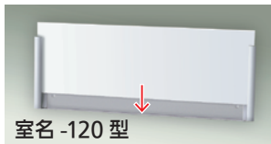
室名 -120 型