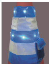
LC カバー B