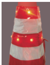
LC カバー R

LED 数：合計 14 個 / 電源：単 3 乾電池 防雨型構造・スイッチ付き電池ケースを内蔵