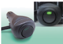
シガレットプラグにスイッチ付