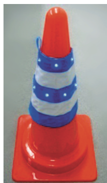
コーン(別売)への装着例 (カバー全高：約 300mm)