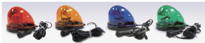
車載 BFM-LED 赤

DC12V/24V のいずれの車両電源でも使用できる、車載型の LED 回転灯です。 球切れしない高輝度 LED の光を、多面式反射鏡の回転で強力に拡散させます。