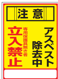
アスベスト -28 250×350×1.0 mm