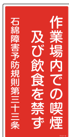
アスベスト -23 300×600×1.0 mm