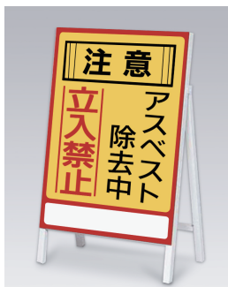
アスベスト -1 500×700mm(板面サイズ) 硬質塩ビ樹脂 + スチール枠足