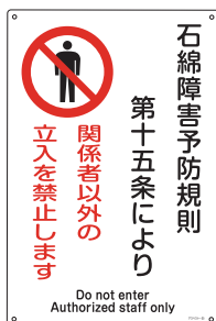
アスベスト -25 300×450×1.0 mm