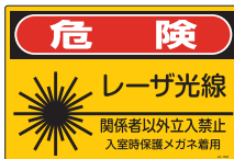
JA-603 (L) (S)