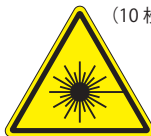
レーザー-A (大) (小)