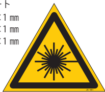
JA-601 (L) (M) (S)