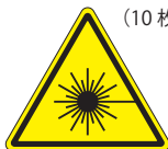
レーザー-A (大) (小)