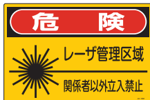
JA-602 (L) (S)

■ サイズ / (L=大) W450×H300×1.0 mm ・ (S=小) W300×H225×1.0 mm