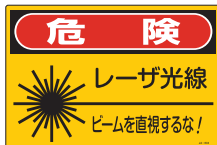
JA-604 (L) (S)